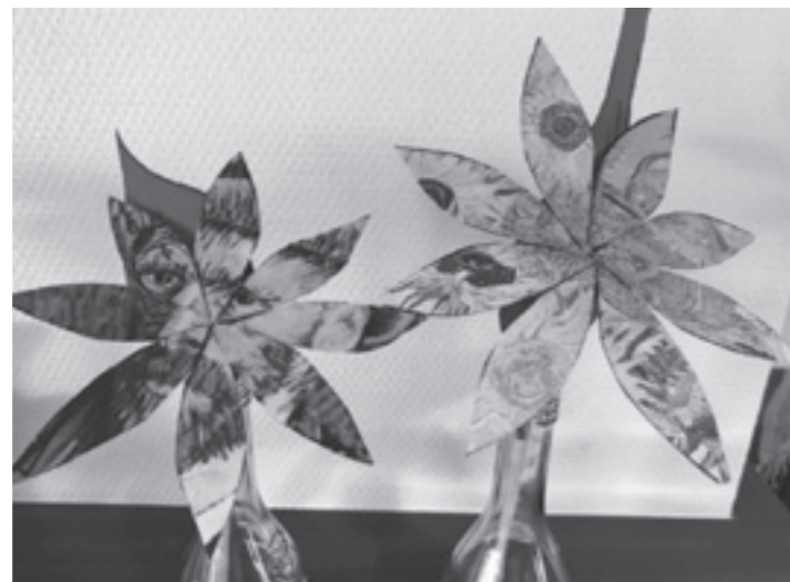
Om in de stemming te komen hadden de deelnemers van het dagcentrum al prachtige bloemen gemaakt.

Op de woensdag kwam een museumdocent uitleg geven over alle topstukken. Eén voor één werden de schilderijen besproken. Je gaat veel beter kijken en ziet dan toch veel meer dingen in een schilderij. Wat een inspirerend en leerzame ochtend.