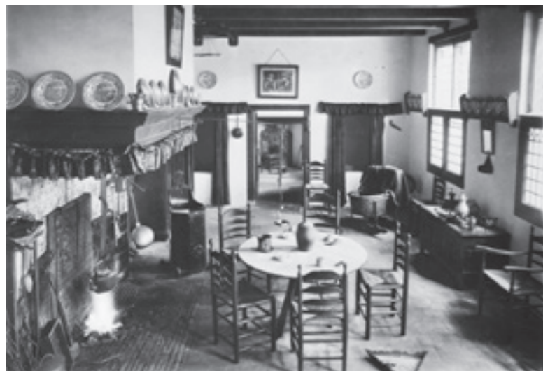
Museumboerderij de Lebbenbrugge

Dit gezegde vindt zijn oorsprong in de koude winterdagen. Als het heeft gesneeuwd en je loopt op klompen buiten, gaan er klonten sneeuw onder de klompen zitten. Als je weer naar binnen gaat en de deur opendoet, kan het gebeuren dat je door de sneeuwklontjes uitglijdt en hierdoor de deur openvliegt en met een klap tegen de muur aanslaat. Het gesprek binnen werd stopgezet door de schrik en alle aandacht was op het slachtoffer gevestigd.